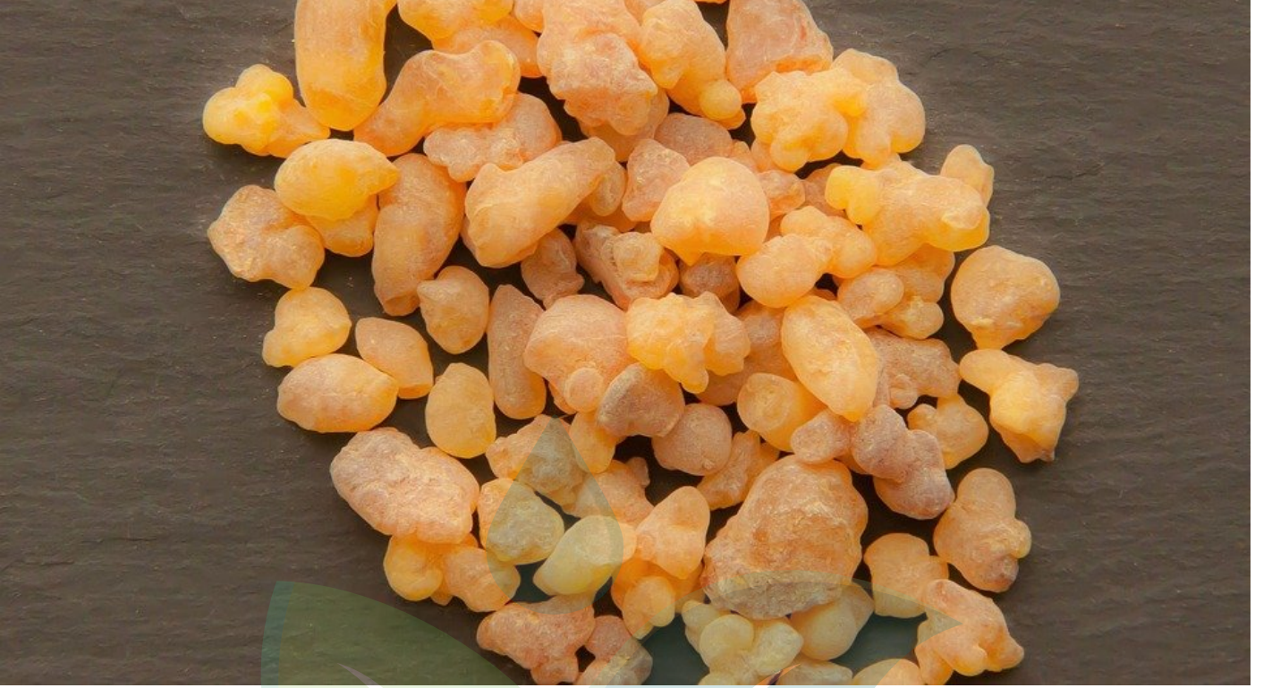
Resim 1: Akgünlük Sakızı